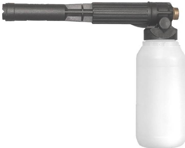
Adapter 1-3 und Schaumsieb 4